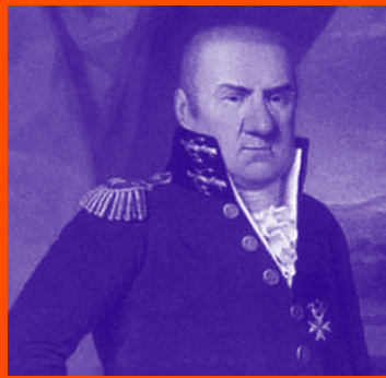
(Rota Imagna/Bergamo 1744 – San Pietroburgo 1817)

Grande architetto e raffinato disegnatore, è uno degli artisti più illustri e prolifici del movimento neoclassico europeo. Dopo gli anni giovanili a Bergamo, nei quali si indirizza allo studio della pittura, meno che ventenne si trasferisce a Roma per formarsi come artista negli studi di Anton Raphael Mengs e poi di Stefano Pozzi. È qui che avverte la propria intima vocazione per l'architettura, non scordando però mai la passione per il disegno. La svolta è costituita dall'invito in Russia come Architetto di Corte da parte di Caterina II. Con l'arrivo a San Pietroburgo all'inizio del 1780 prende subito avvio una stupefacente e frenetica carriera professionale. Sbalorditivo è il numero dei progetti e delle realizzazioni di Quarenghi nella capitale russa, nelle tenute dei dintorni, ma anche a Mosca e in altri territori dell'impero. Suoi sono veri e propri landmarks della città di San Pietroburgo, come la Banca di Stato, l'Accademia delle Scienze, l'Istituto Smol'nyj e numerosi interventi nel complesso del Palazzo Imperiale (Sala del Trono, Teatro dell'Ermitage). La sua fortuna prosegue con i successori di Caterina la Grande: Paolo I e Alessandro I. Il susseguirsi di impegni professionali gli consente un solo breve rientro in patria (1810-1811), ma nuovi progetti lo attendono in Russia, dove conclude la propria vita.